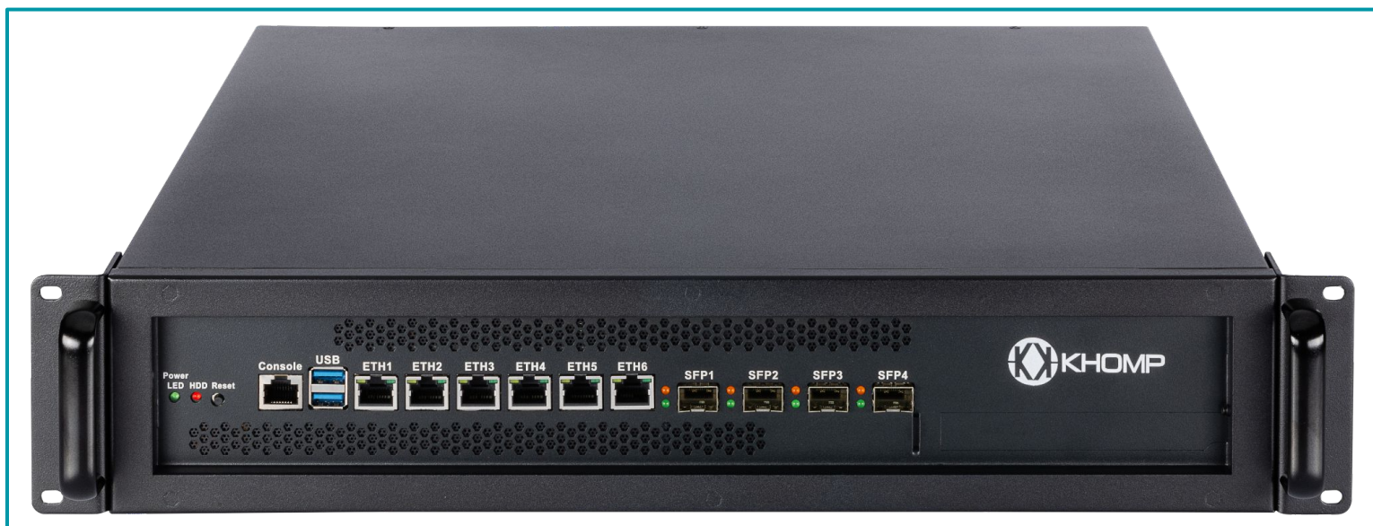
Legenda: Visão superior frontal.