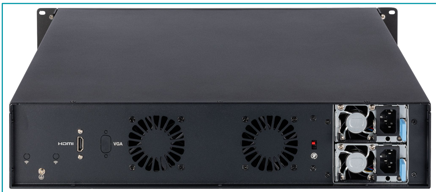
Legenda: Visão superior traseira.