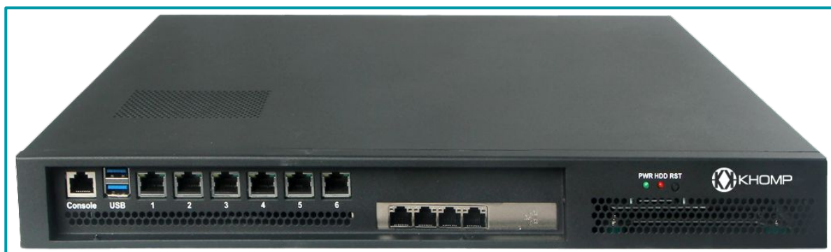
Legenda: Visão superior e frontal com placa de rede adicional 4 x LAN.