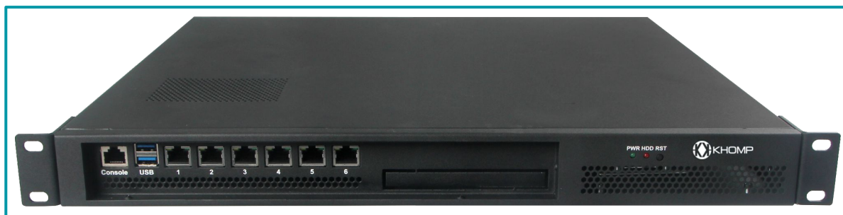
Legenda: Visão superior e frontal com abas de fixação para rack