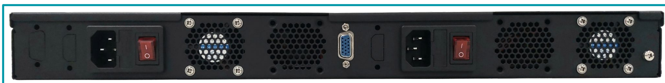
Legenda: Visão traseira.