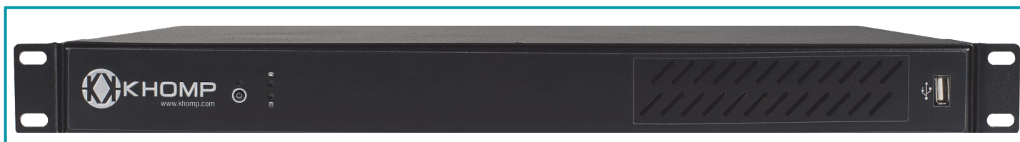
Legenda: Vista frontal.