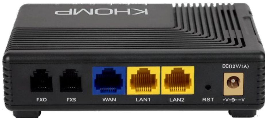
Visão traseira com portas FXO e FXS , portas WAN e LAN, botão de reset e entrada para fonte de energia.