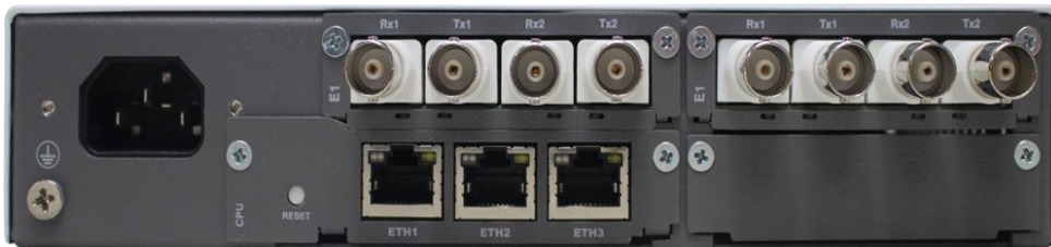
Legenda: Visão traseira.