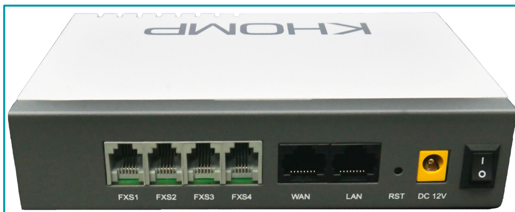
Legenda: Visão traseira com 4 portas FXS, portas LAN e WAN, botão RST, entrada para fonte de energia e botão interruptor para ligar ou desligar o equipamento.