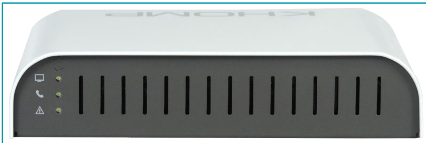
Leyenda: Vista frontal.