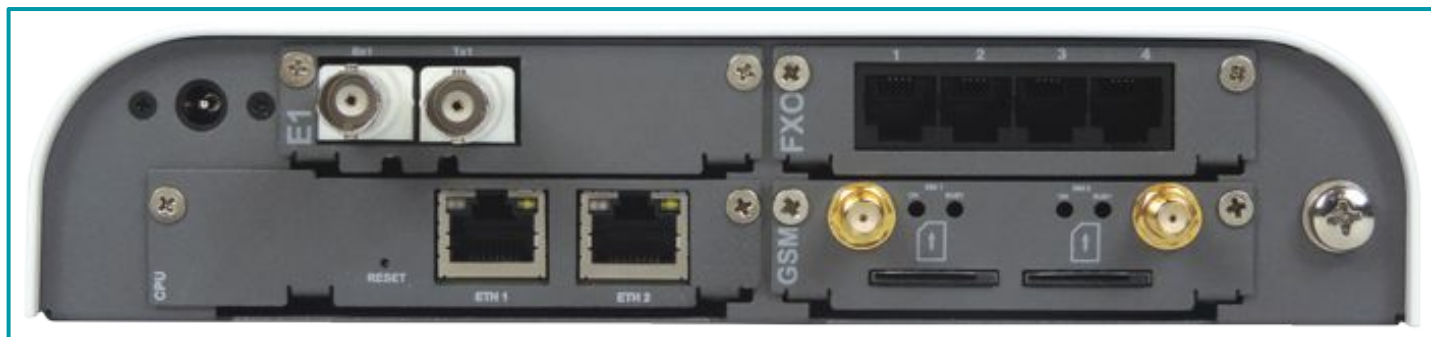
Leyenda: Vista posterior - 1E1 + 4FXO + 2GSM.