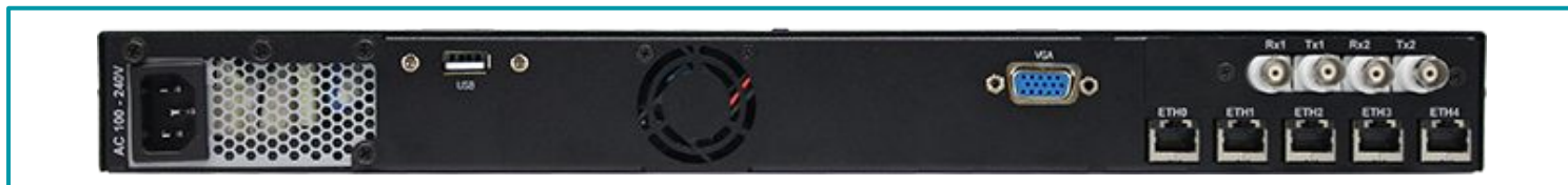
Leyenda: Vista posterior.