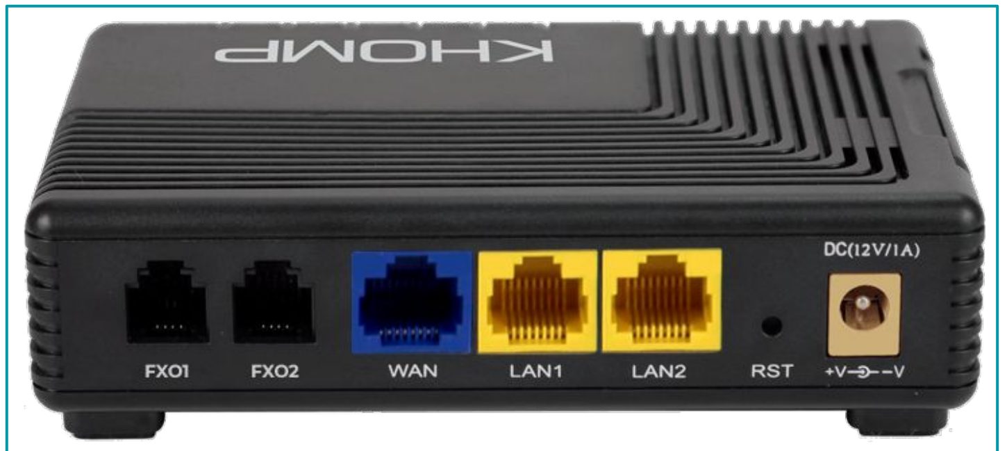
Visão traseira com portas FX0, portas WAN e LAN, botão de reset e entrada para fonte de energia.