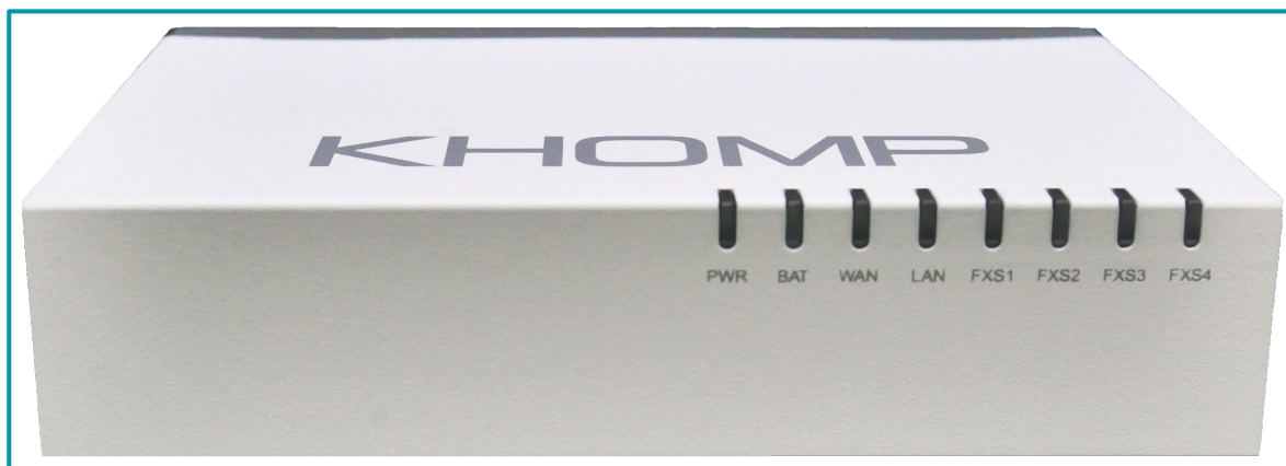
Legenda: Visão frontal com LEDs indicadores.